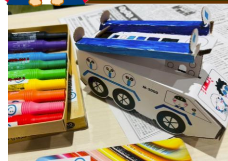
【ペーパークラフトで作る貯金箱】