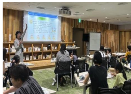
【お金の学校の様子】